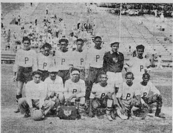
La Selección Panameña que ayer cayó por 11 goles a 0